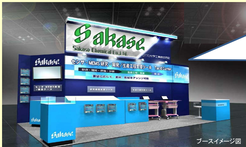
ブースイメージ図

来る2015年4月22日(水)~24日(金)、 パシフィコ横浜にて 「ナノ・マイクロビジネス展/ROBOTECH」 が開催されます。